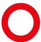
1 Vorschriftssignal: Allgemeines Fahrverbot