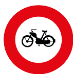
2 Vorschriftssignal: Verbot für Motorfahräder