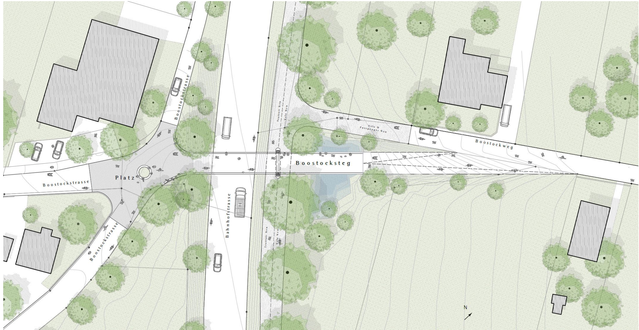
Abbildung 4; Situationsplan, Timbatec Holzbauingenieure (Schweiz) AG