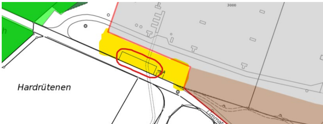
Abbildung 6; Parkplätze Hardrütene

Weiter befinden sich in unmittelbarer Nähe bereits bestehende Rohrblöcke / Kabeltrassen, die im Bereich der gelb markierten Länge (s. Bild unten) verlängert werden müssen. Der Anschluss bezüglich Kosten wie Bautätigkeiten in die bestehenden Rohrblöcke erweist sich so ebenfalls als auf das Minimum reduziert und es werden keine Familiengärten mit neuen Leitungsführungen beeinträchtigt.