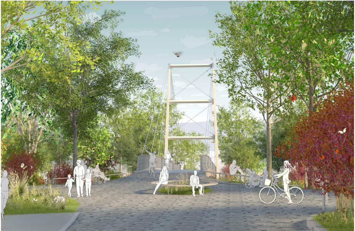
Abbildung 2; Visualisierung Boostocksteg, Timbatec Holzbauingenieure (Schweiz) AG