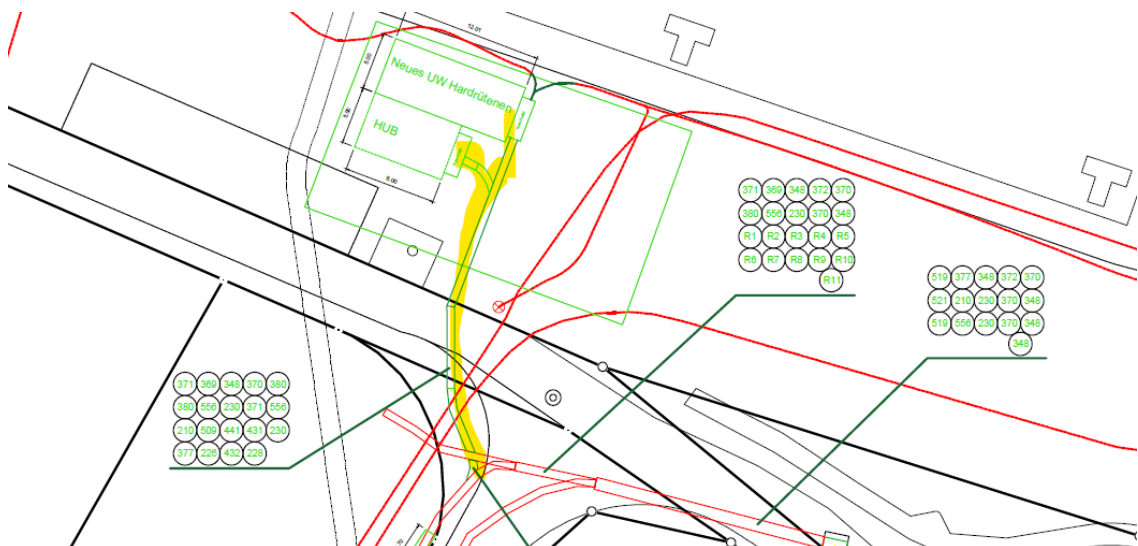
Abbildung 7; Kabeltrassen neuer Standort Unterwerk

Alle bestehenden Hauptkabel der EVS müssen bis im Jahr 2028 erneuert resp. ersetzt werden. Darunter fallen auch die Kabel, die vom AEW-Unterwerk Spreitenbach zum Übergabepunkt an das EVS am geplanten neuen Standort vorbeiführen. Auch diese genügen den Anforderungen der Einspeisung AEW – EVS nicht mehr und müssen unabhängig der Standortwahl in jedem Fall ersetzt/verstärkt werden. Mit dem neuen Standort müssen nur im Bereich der gelben Markierung die zu ersetzenden Kabel verlängert werden. Diese Verlängerung ist im vorliegenden Kreditantrag berücksichtigt.