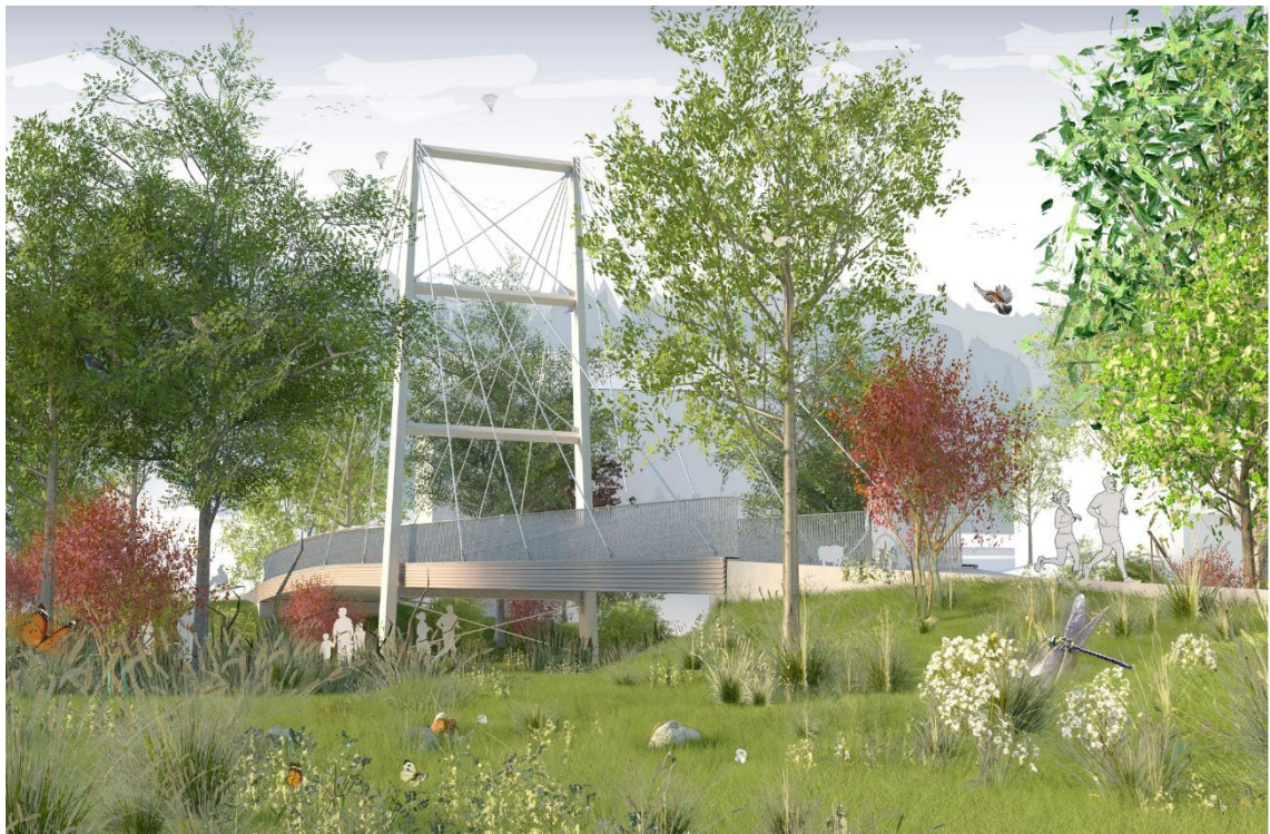
Abbildung 1; Visualisierung Boostocksteg, Timbatec Holzbauingenieure (Schweiz) AG

Der Gemeinderat beantragt der Einwohnergemeindeversammlung vom 25. Juni 2024 den Kreditantrag zur Projektierung und Realisierung des neuen Boostockstegs in der Höhe von CHF 1'690'000. Der Kreditumfang basiert auf dem Entwurf zum neuen Boostocksteg der Firma Timbatec Holzbauingenieure (Schweiz) AG, Zürich, welcher im Rahmen eines Studienauftrags ermittelt wurde. Dabei überzeugten die Projektverfasser mit ihrem innovativen Entwurf, welcher nicht einfach nur das bestehende Bauwerk ersetzt, sondern zugleich einen umfassenden Ansatz und Anstoss zur weiteren Entwicklung eines zukünftigen Parks im Zentrum von Spreitenbach liefert. Der Kreditumfang besteht auf dem eigentlichen Brückenbauwerk und optional aus der Platzgestaltung / Anpassung im südlichen Bereich an die alte Bahnhofstrasse / Boostockstrasse.