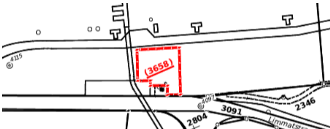
Abbildung 8; Rot umrandet die geplante Baurechtsfläche mit der zukünftigen Kat.-Nr. 3658

Die betroffene Parzelle Kat.-Nr. 3'000 gehört der AXPO Grid AG, Baden. Das Bauen darauf erfordert daher einen Baurechtsvertrag. Verhandlungen mit der Axpo Grid AG haben gezeigt, dass auf deren Land der neue Standort unter Berücksichtigung von deren Entwicklungsplanung möglich ist und diese mit dem Neubau nicht konkurrenzieren wird. Die schriftliche Zusage zur Errichtung des erforderlichen Baurechtes liegt seitens Axpo Grid AG vor. Ebenso sind die Mutationstabelle und der Baurechtsvertrag, welcher statt der üblichen 40 Jahre grosszügigerweise auf 80 Jahren verhandelt werden konnte, im Entwurf vorhanden. Das Baurecht beinhaltet eine Fläche von 282 m 2 und wird entweder als Einmalbetrag für die gesamte Vertragsdauer oder als Baurechtszins jährlich beglichen. Bei einem Landpreis von CHF 250.00 / m 2 und 2 % Verzinsung resultiert ein Baurechtszins von max. CHF 1'500.00 / Jahr oder eine einmalige Abgeltung in der Höhe von ca. CHF 100'000. Im Falle der Regelung als Einmalvergütung des Zinses wäre mit Vertragsbeginn allerdings die Gründung der AG EVS abzuwarten. Die Begleichung des Baurechtszinses wird im Vertrag nur bei Annahme des Baukredites an der Gemeindeversammlung definitiv geregelt. Dieser ist über das Budget resp. über die laufende Rechnung zu finanzieren und nicht im Kreditantrag enthalten.