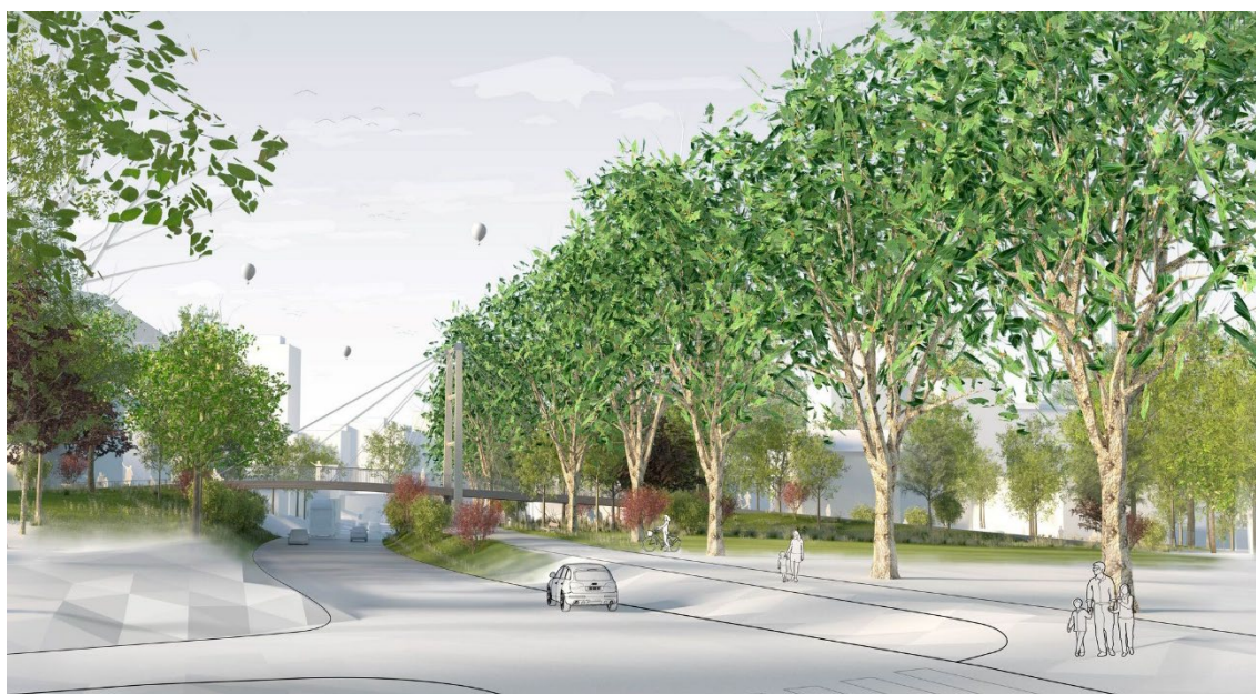
Abbildung 3; Visualisierung Boostocksteg, Timbatec Holzbauingenieure (Schweiz) AG