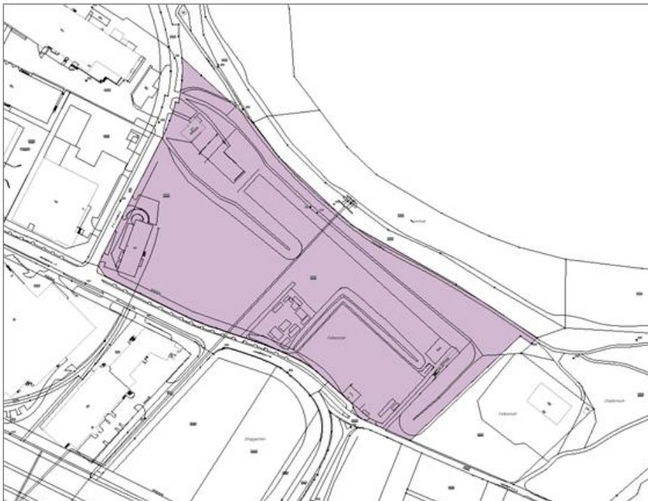
Abbildung Situation Härdli, Parzelle 2345